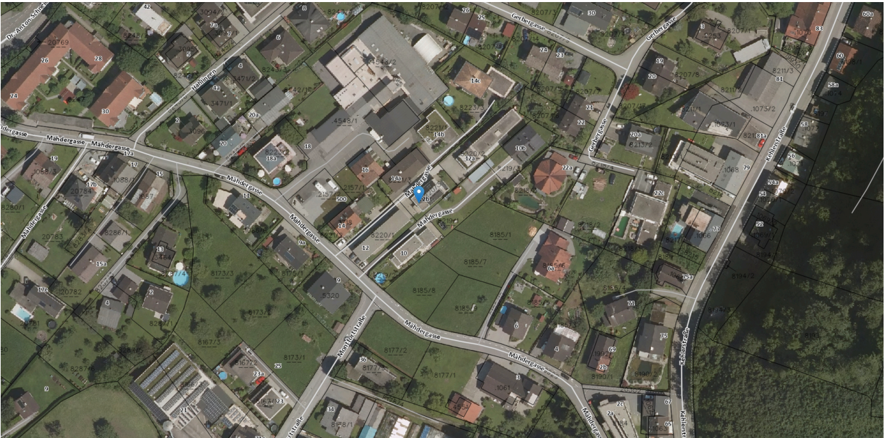
Vogis GP 8220:3