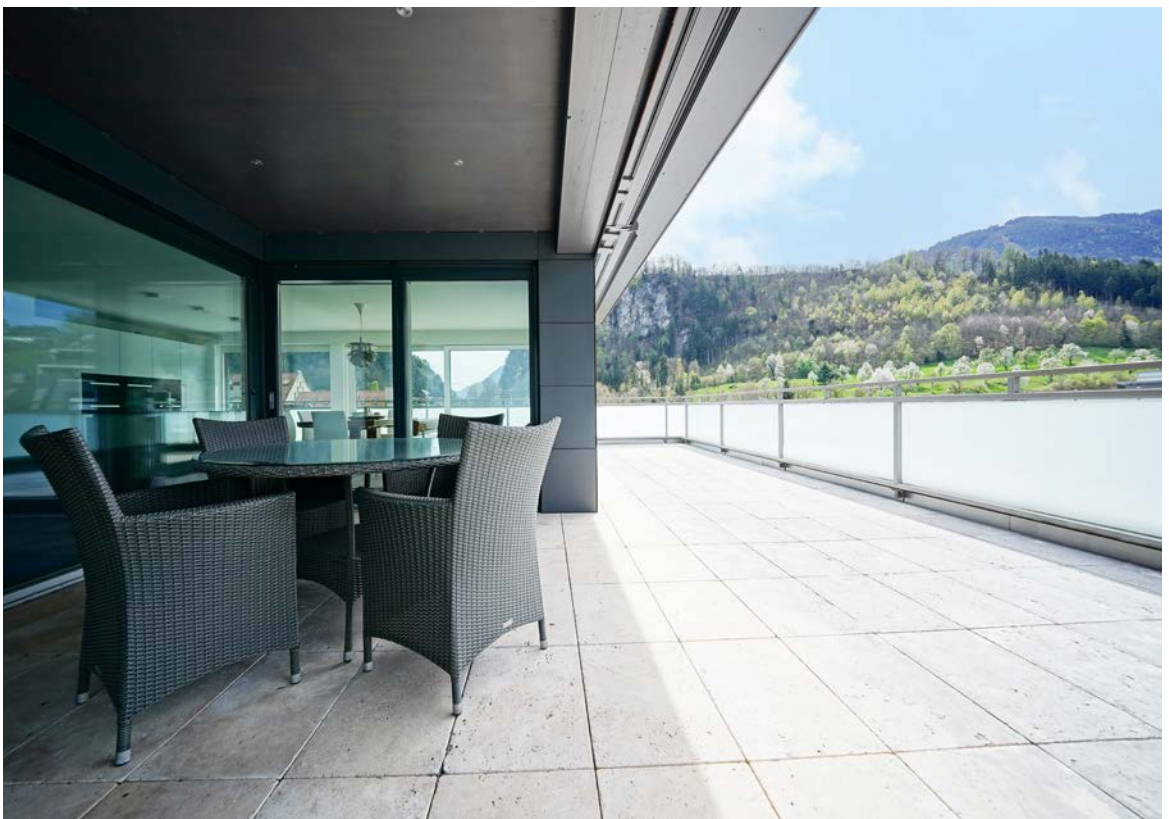
Sitzplatz mit Aussicht