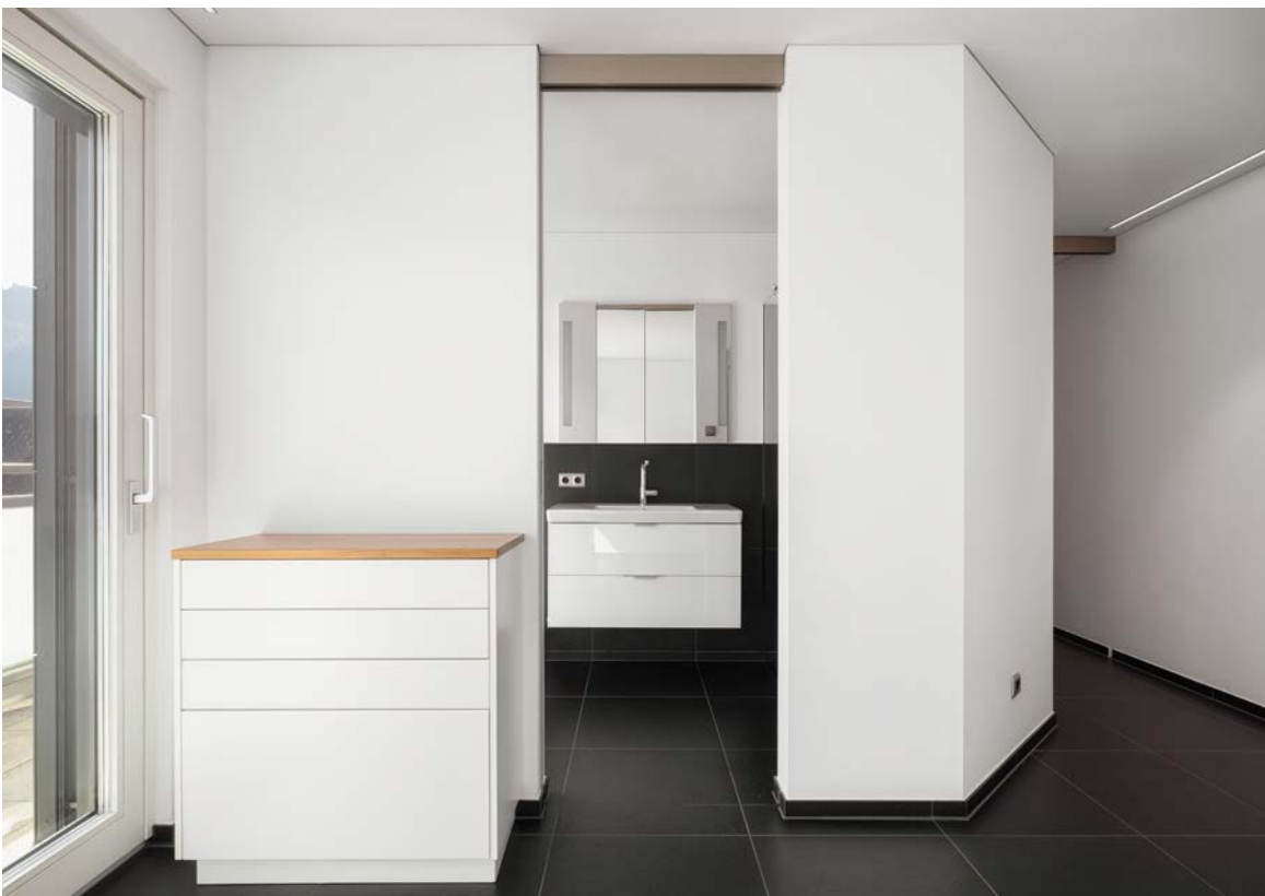
Zimmer_Zugang zu Bad I