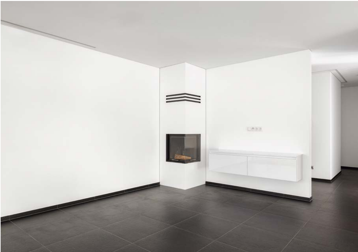
Wohnen mit Kamin