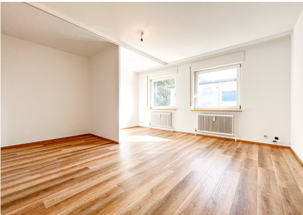
Schlafen / Essen / Wohnen