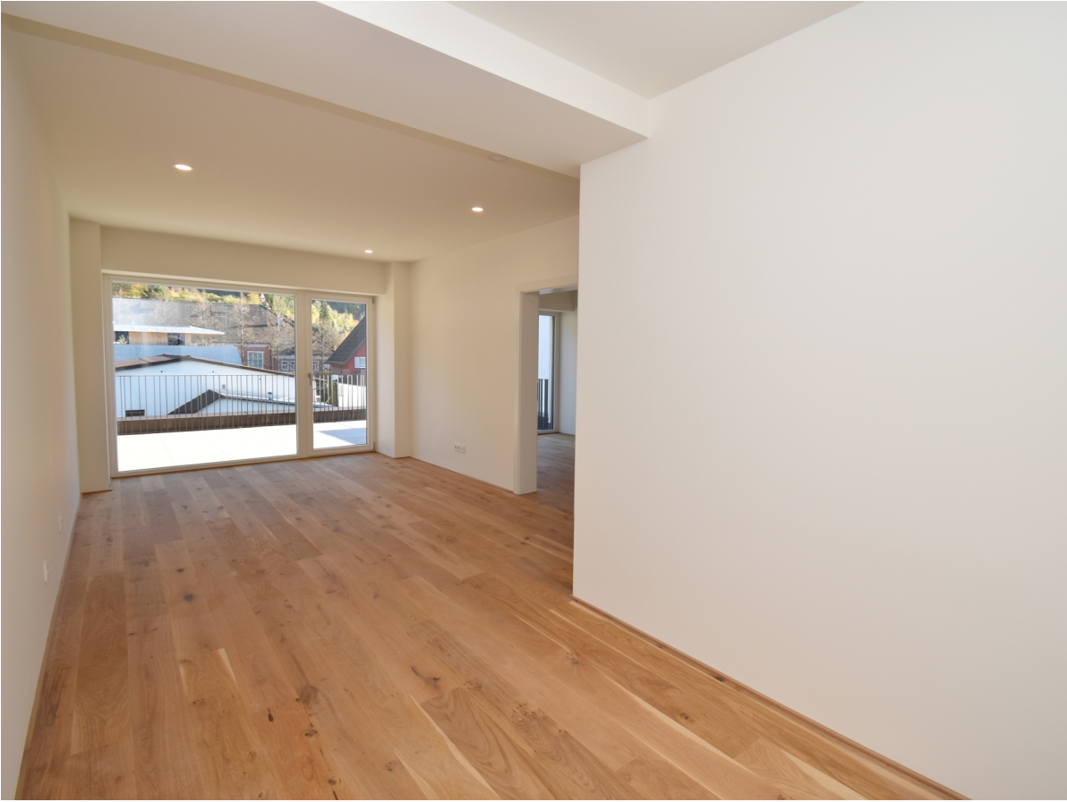
Koch- und Essbereich