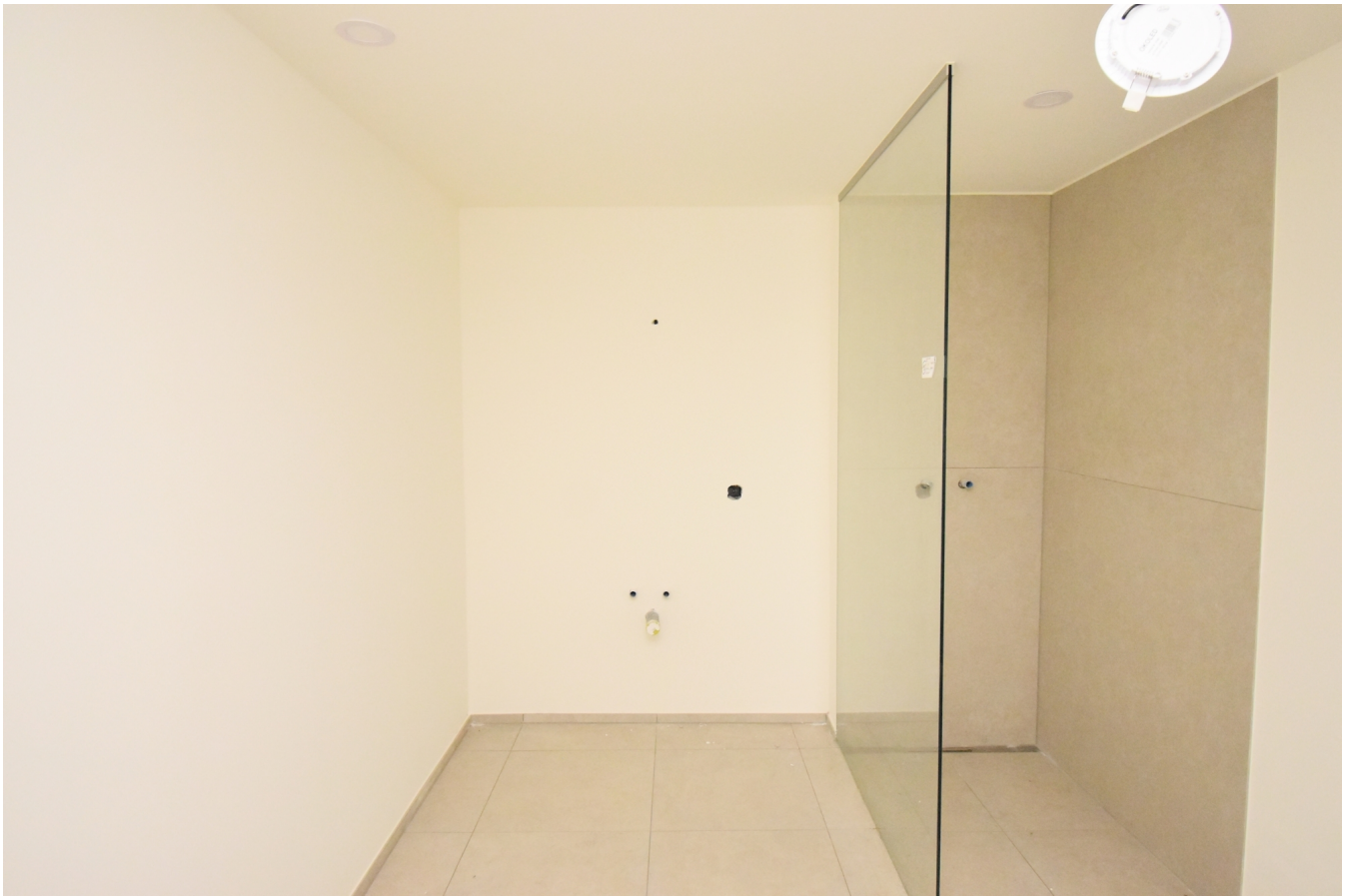
Bad / WC