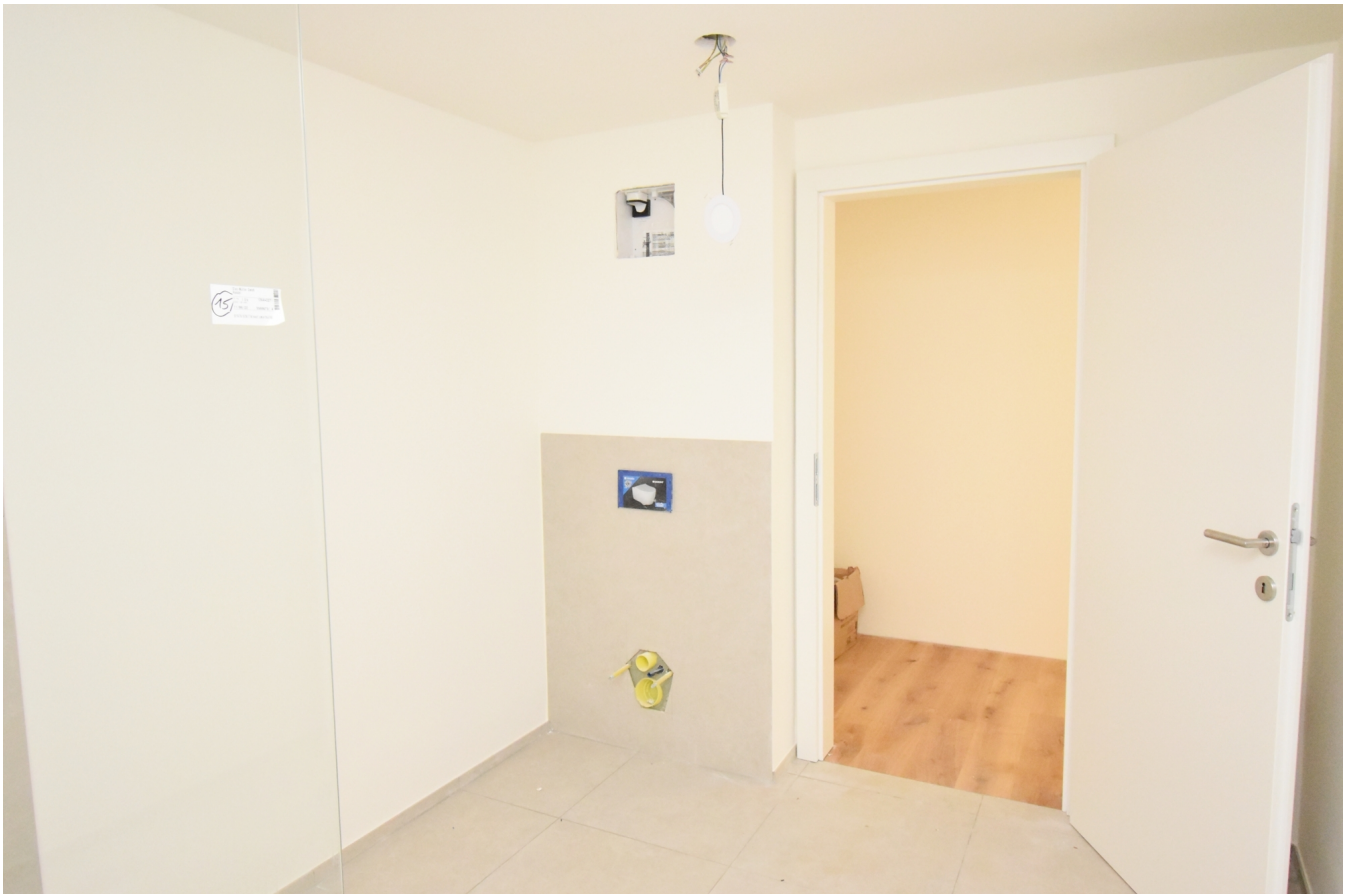
Bad / WC