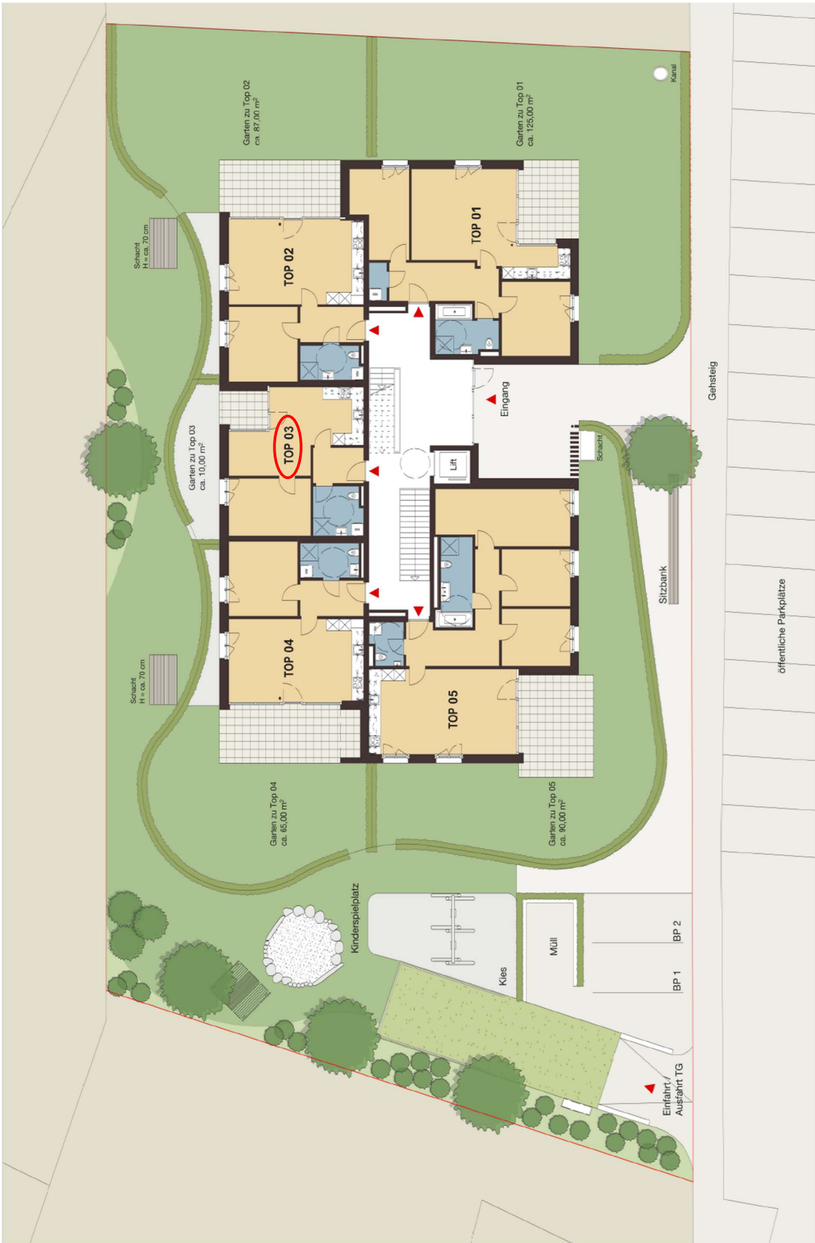
Lage des Kaufobjektes